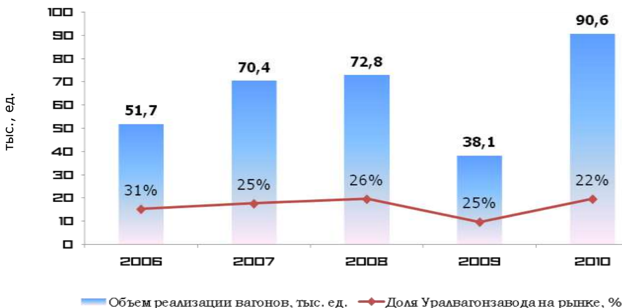
Динамика реализации грузовых вагонов всех видов предприятиями стран СНГ и рыночной доли Уралвагонзавода в 2006-2010гг.

Доля ОАО «Научно-производственная корпорация «Уралвагонзавод» на рынке вагоностроения стран СНГ составила 22 % .