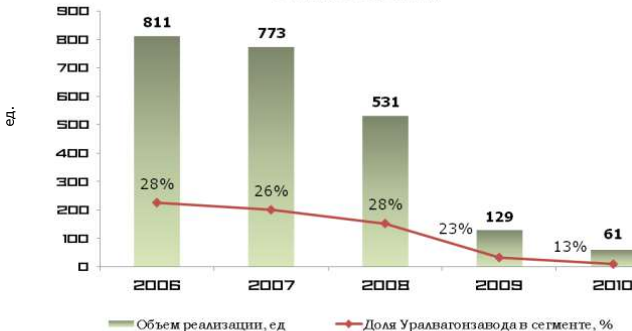
Динамика реализации колесных экскаваторов массой 18-23т российскими предприятиями и доля Уралвагонзавода в данном сегменте в 2006-2010 гг.